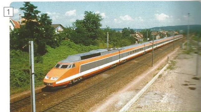
1 Travel around Europe with an Interrail pass. One pass, 30 countries. Maximum experience on a minimum budget