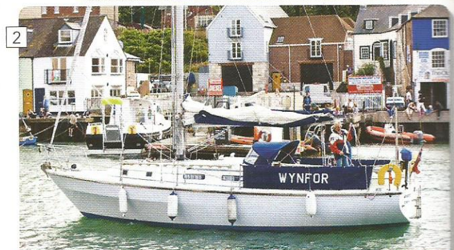
2 SAIL ALONG THE COAST OF BRITAIN